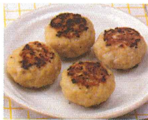
Teig mit Fleischfüllung