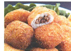
Krokette mit Fleischfüllung