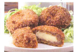
Gehacktes mit Käse