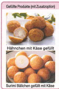
Gefüllte Produkte (mit Zusatzoption)