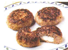
Hamburger gefüllt mit Käse