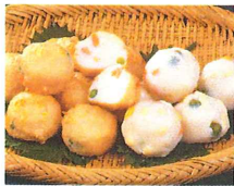
Surimi mit Gemüse

2-reihiges "High Speed" Formen, Füllen und Portionieren.