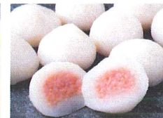
Gefüllte Surimi Bällchen